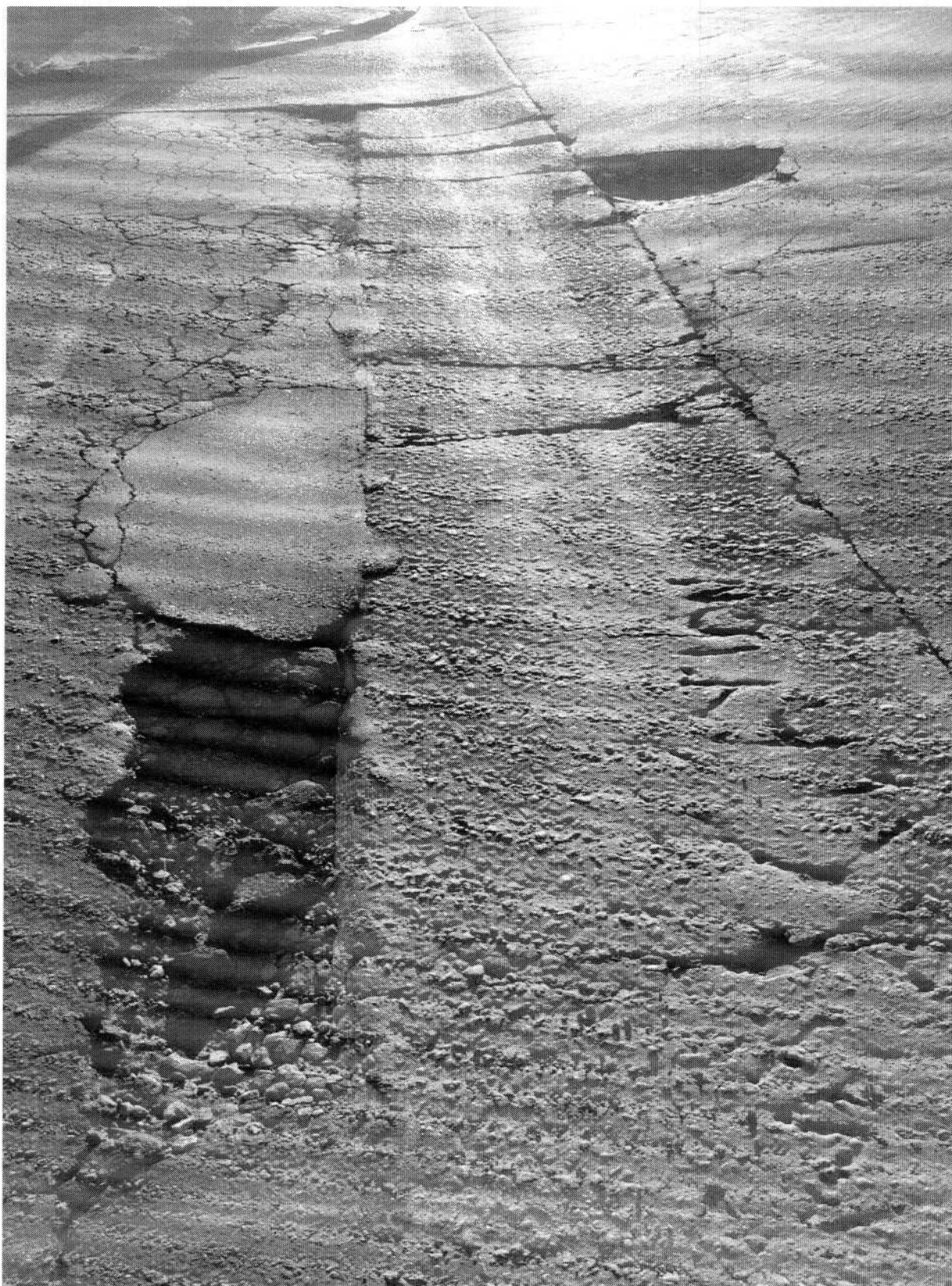
Manutenção Asfáltica em toda extensão Rua Lindenberg, Jd Aeroporto III, Mogi das Cruzes